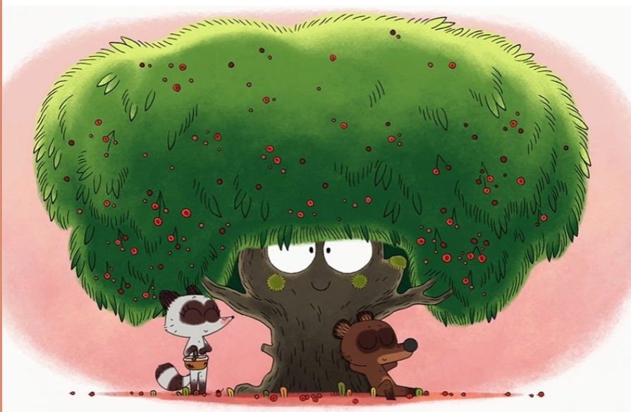
"Pompon Little Bear"

Dandeloo a signé un accord global avec le site chinois Youku qui permettra à plus de 420 épisodes de ses séries d'être disponibles sur Youku Kids .